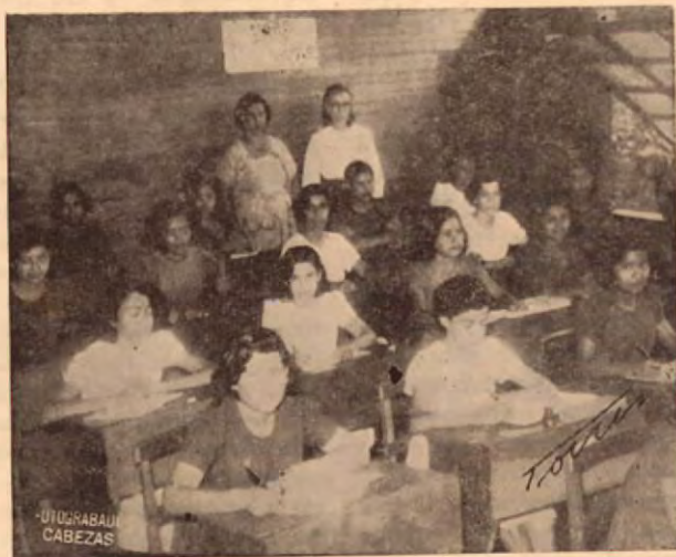
El 5º grado y su maestra posan para la Revista

gún tiempo de capa caída y en cierta ocasión aproximadamente, cuando para salvarlo de la clausura, que se encomendó su regencia a la Asociación de las Misioneras de la Asunción.