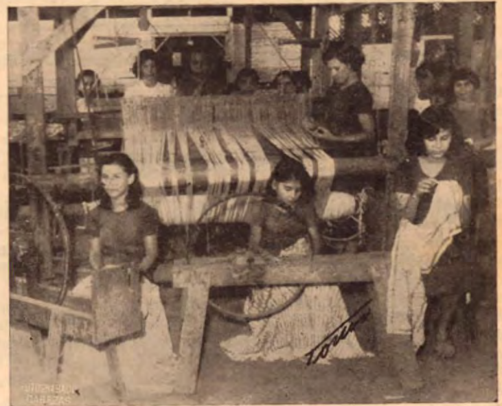
Un grupo de niñas en el telar

Estuvimos media hora de visita en el Hogar Cristiano de esta ciudad. Llevamos con nosotros el fotógrafo Torres. Desde que se retiraron las Monjitas que lo regentaban no habíamos vuelto en plan periodístico. Cuando las Monjitas se fueron, este centro anduvo al-